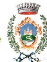
Comune di Monticello Conte Otto